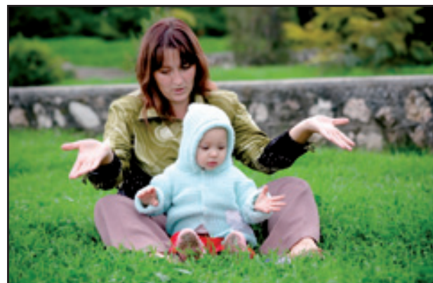
Pendant combien de temps aura-t-on droit au congé parental d'éducation ?

Aujourd'hui, ce congé parental est en voie d'être réformé. L'éloignement trop long du marché de l'emploi et la difficulté à retrouver un travail pour les mères de familles, la répartition inégale entre les mères et les pères de famille alors que ces derniers souhaitent de plus en plus une égalité au sein du couple... sont les principaux arguments au changement. Le dossier est actuellement dans les mains du Haut Conseil de la Famille, instance présidée par le Premier ministre, et qui a pour objectif de renforcer l'efficacité de l'action en faveur des familles, dans lequel siège l'Union Nationale des Associations Familiales (U.N.A.F.). Plusieurs scénarios sont en cours de débat : raccourcir la durée du versement du C.L.C.A. à 12 ou 24 mois à partir du 2 ème enfant, réduire dans tous les cas de figure l'allocation à un an mais avec une meilleure rémunération, verser une prestation proportionnelle au salaire, fractionner le congé, prévoir une prime pour le père s'il prend lui-même une partie du congé, laisser le choix à chaque famille de décider ce qui lui convient le mieux... Il est important de mesurer les effets de ces propositions, dans l'intérêt de TOUTES les familles. L'U.D.A.F. de l'Isère est attachée au principe de libre choix des familles.