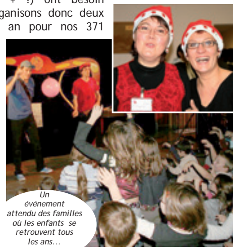
Un événement attendu des familles où les enfants se retrouvent tous les ans...

Contact : Jumeaux et Plus, 04 76 35 21 12, multiples.38@wanadoo.fr