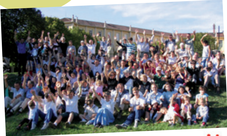
L'équipe de la Fédération de l'Isère des A.F.C. lors de la fête des familles